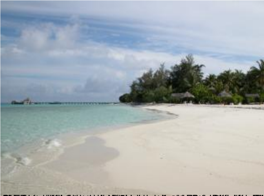
Maayafushi, Maldives, November 2002